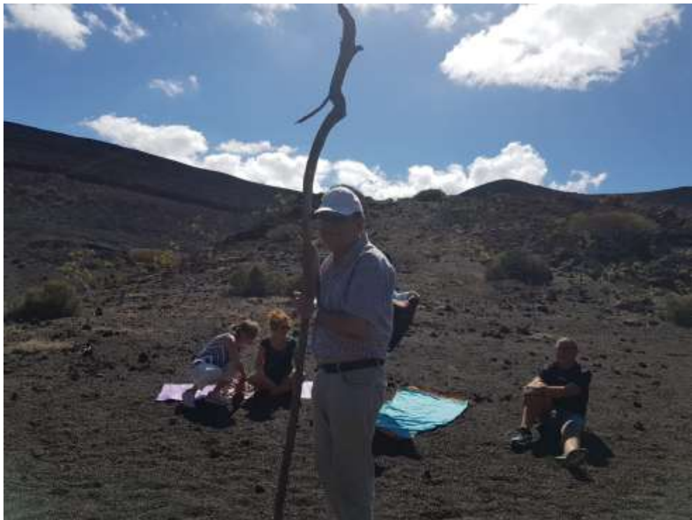
En el Volcán de la Abducción, con un cayado encontrado en el camino, 12-10-2018