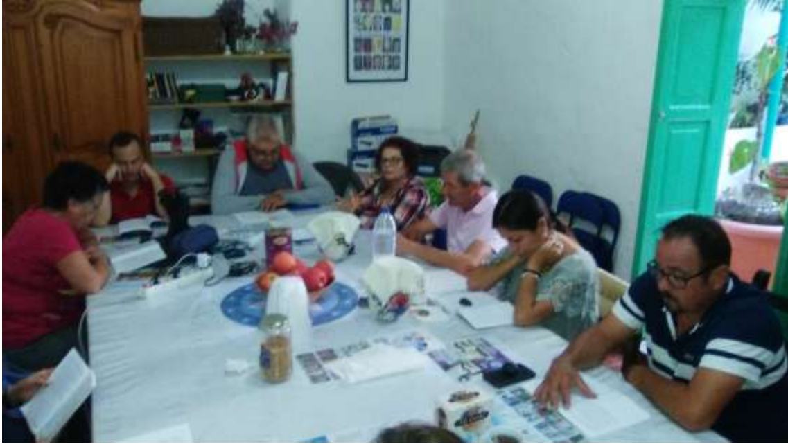
Comienzo de un nuevo Curso Holístico en Tegoyo, 17-10-2018