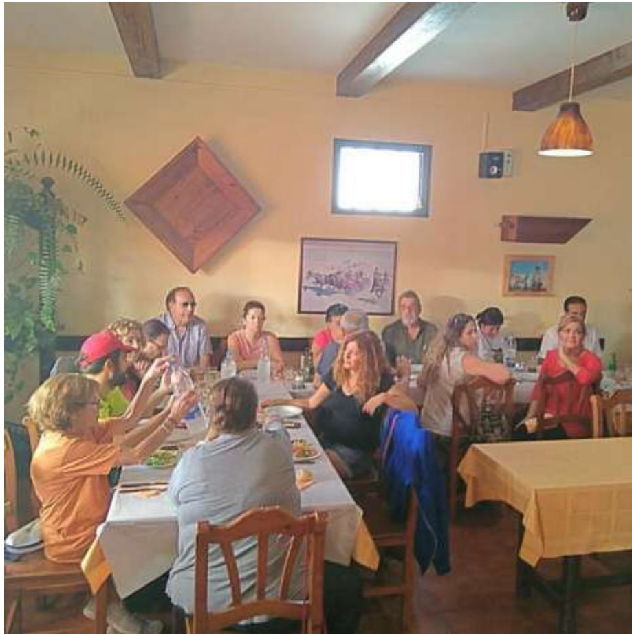
Almuerzo en el Bodegón de Tao, 9-10-2018