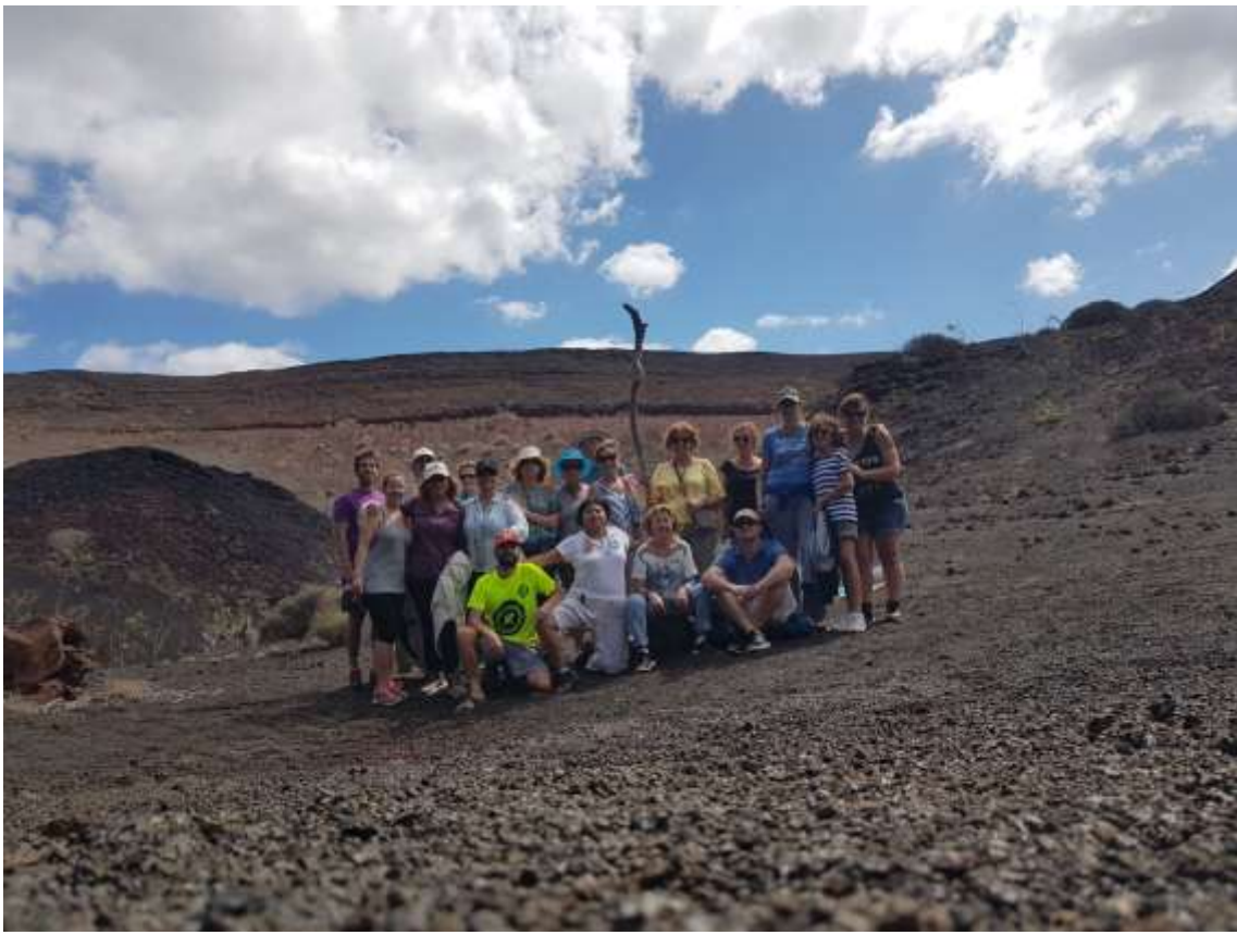
Unidos en el Volcán de la Abducción

Hoy hemos realizado una visita al Volcán de la Abducción, por la mañana, en la tarde hemos escrito el resultado de la extrapolación y del rescate adimensional de la visita a la base submarina de Canarias, cuyos resultados se han puesto en común en el TAP transmitido por el Ágora del Junantal. Después, Rasbek nos ha dado el siguiente comunicado, seguido de la entrega de nombres simbólicos, por Shilcars, y de las preguntas y respuestas que se han formulado a Rasbek.