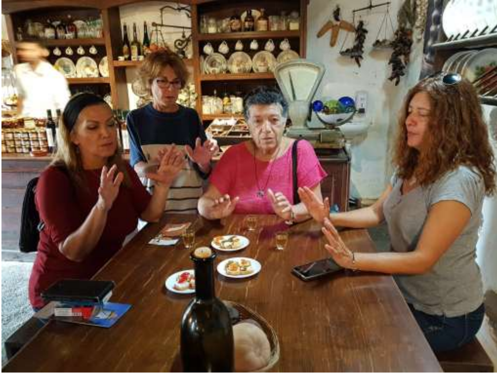
En la tienda del Museo Agrícola de Tiagua, 15-10-2018