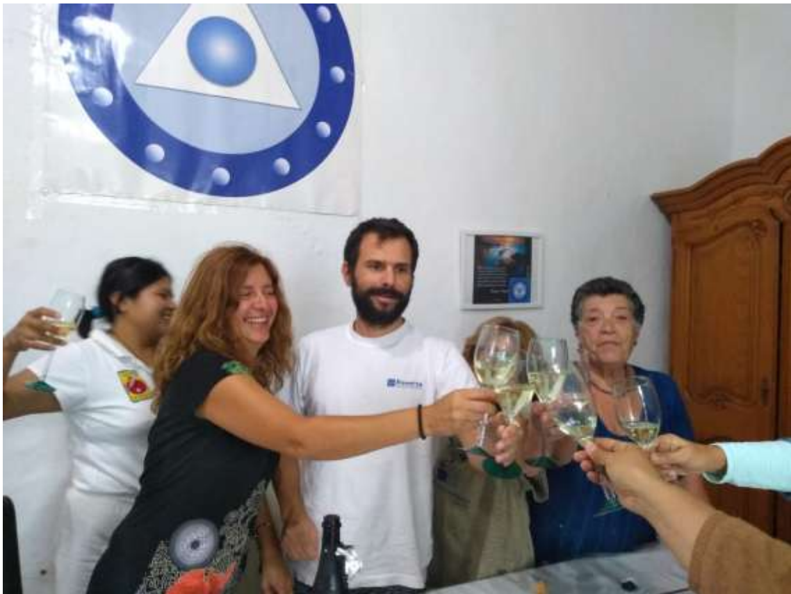
Celebrando el nacimiento de una nueva pareja Muul 16-10-2018