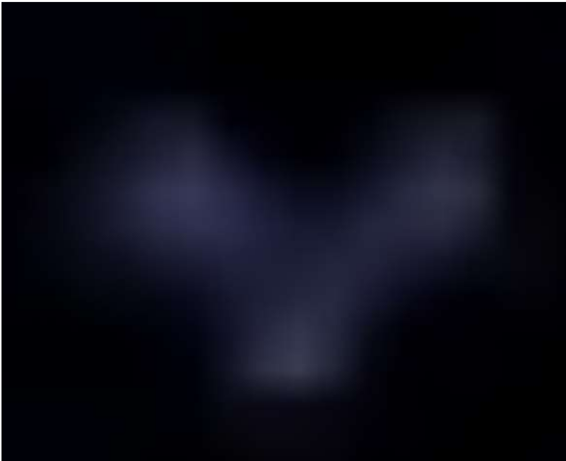
Sugestiva imagen