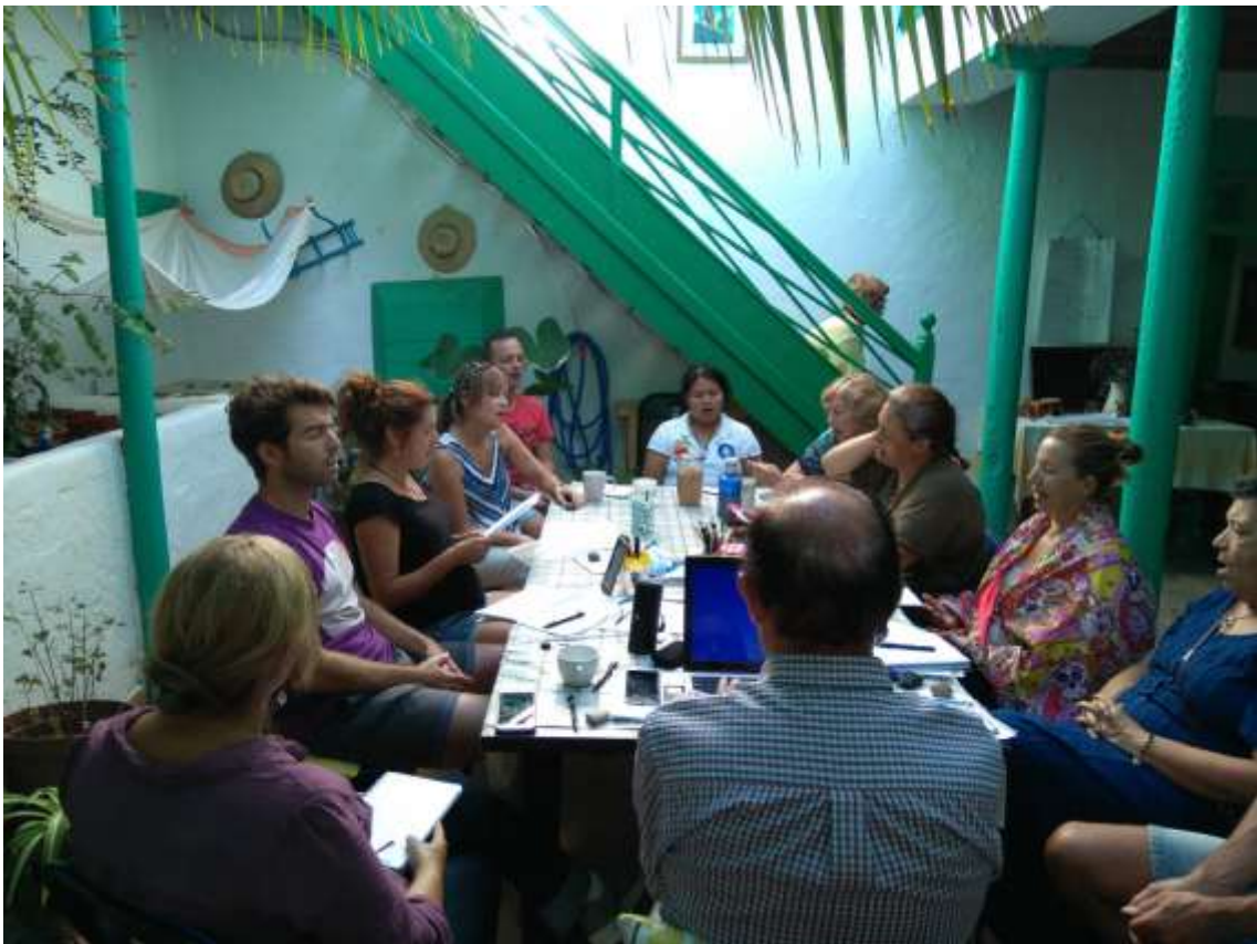
Una de las sesiones de trabajo en el patio de Tegoyo