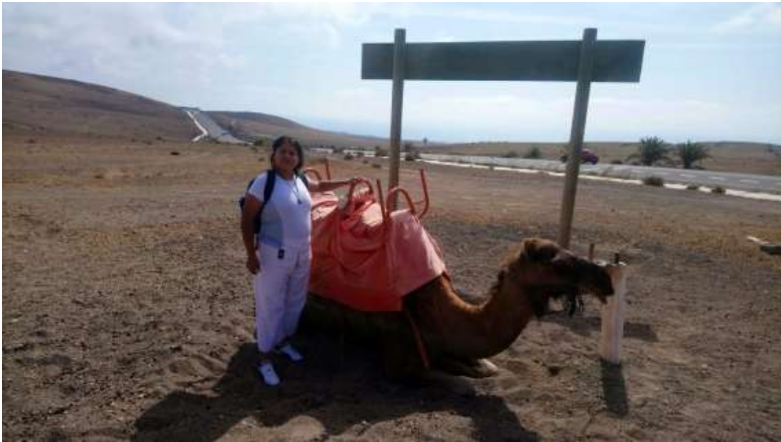
Apuesta Atlante se dispone a montar en camello