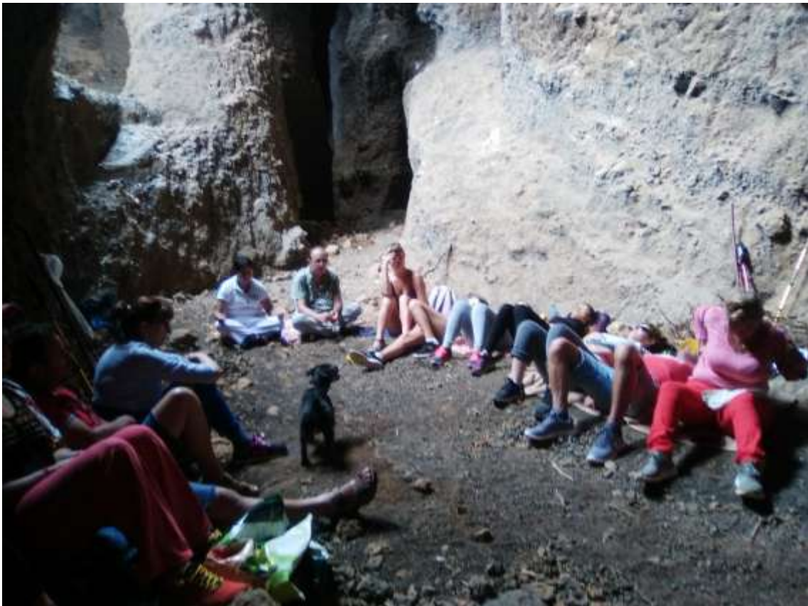
Meditando en el interior de la Cueva de las Torcas, 14-10-2018