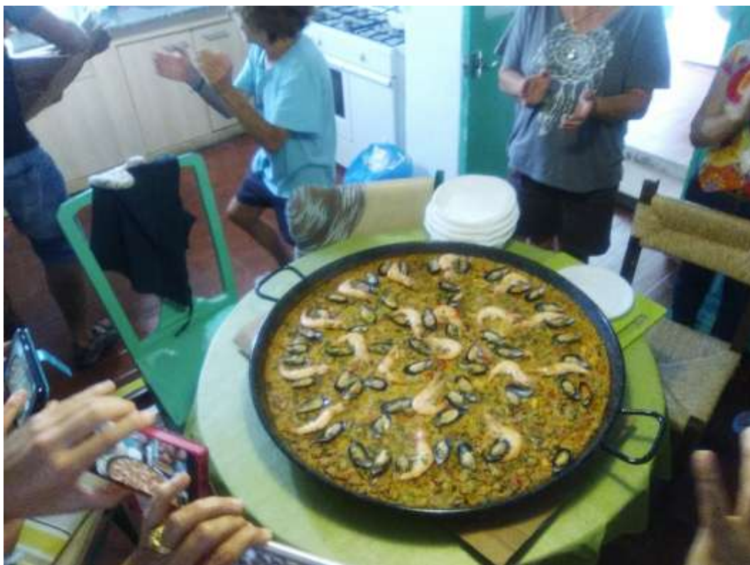
Exquisita paella de mariscos elaborada por los equipos de cocina, 13-10-2018